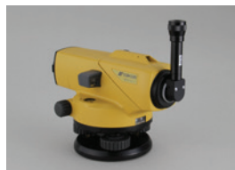
ダイアゴナルアイピース DE16 (AT-B2)

接眼部に取付けることにより、90 度方向からのぞくことができます。低位置での観測や、狭い場所での観測に便利です。