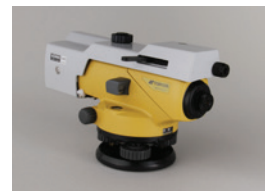
光学マイクロメーター OM5 (AT-B2)

接眼部に取付けることにより、90 度方向からのぞくことができます。低位置での観測や、狭い場所での観測に便利です。