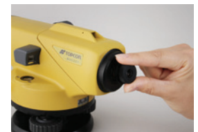
40x 接眼レンズ EL5 (AT-B2)

望遠鏡に光学マイクロメーターを取り付けることにより 0.1mm まで高さを読取ることが可能となります。精密水準測量、工作機械の据付等、高精度が要求される作業に活用いただけます。