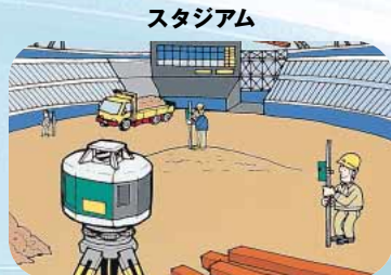
直径600m (LP30A) と広範囲での使用が可能。複数の受光器を使えば、多人数で同時に作業できます。