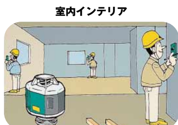
室内インテリアや内装工事に。エレベータ三脚を使えば、レベル高の調整も自在です。