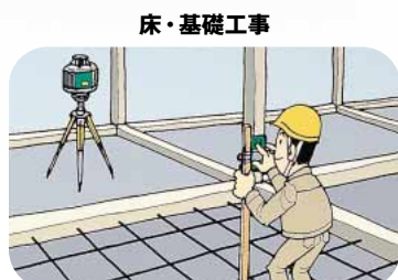
土台・床面のコンクリート打ちに。バカ棒に受光器を取り付けて一人でスムーズに水平出し。