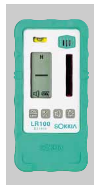
プロテクタLRP1A装着時