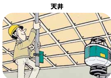
天井の水平出しも一人でラクラク。高所での作業にはレベルアームが便利です。