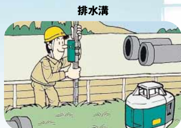
スタッフやデジボーIIと組み合わせれば、排水溝の勾配設定や斜面の比高測定も簡単。