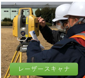
レーザースキャナ