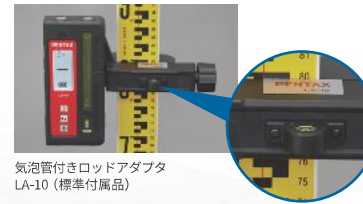
気泡管付きロッドアダプタ LA-10（標準付属品）

受光器単体、またはバカ棒などに取付けて、墨を打つことができます。標尺に取り付けて数値を読み取ることも可能です。