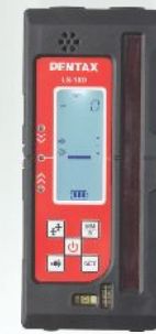
デジタル受光器 LS-10D [PLP-201 標準付属品]