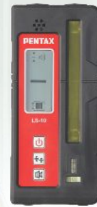
受光器 LS-10 [PLP-202 標準付属品]