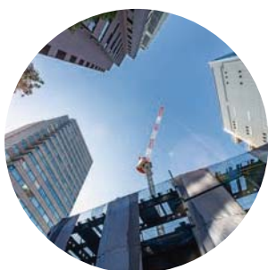
上空視界の狭い 都市部工事