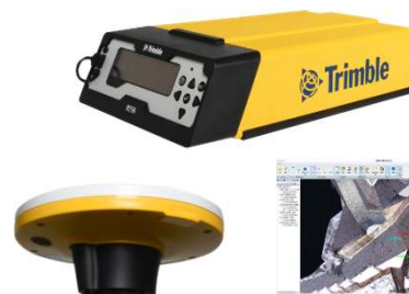
Trimble Catalyst DA2